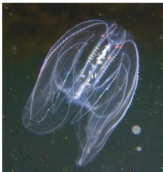
Mnemiopsis leidyi med åtta skimrande ciliekammar längs kroppen.